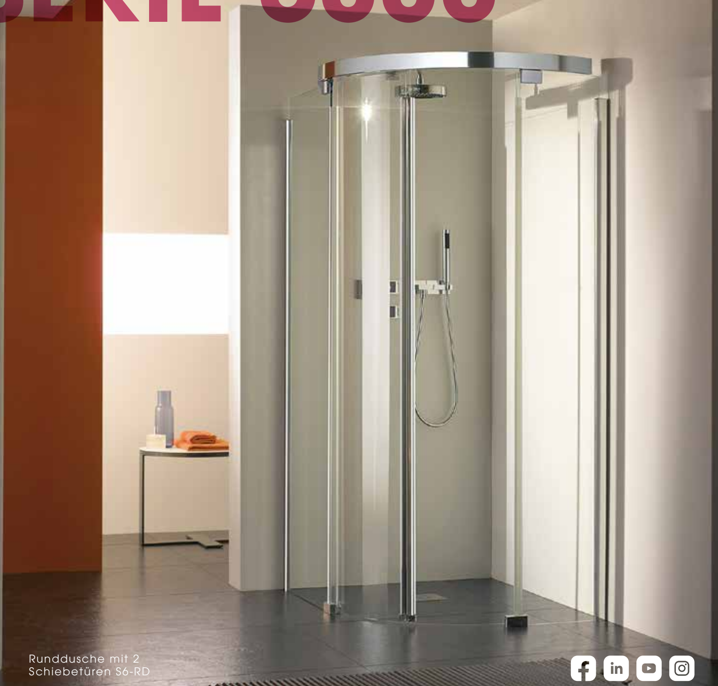
Runddusche mit 2 Schiebefüßen S6-RD