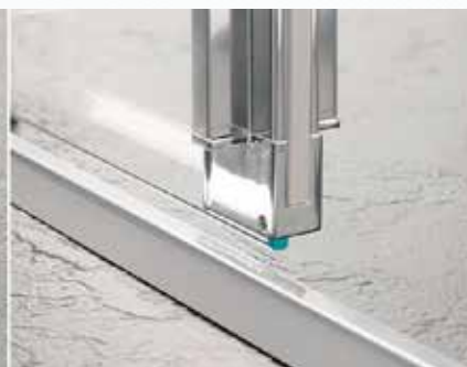
Niedriges Schwallprofil (16 mm)