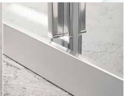
Hohes Schwallprofil (34 mm)